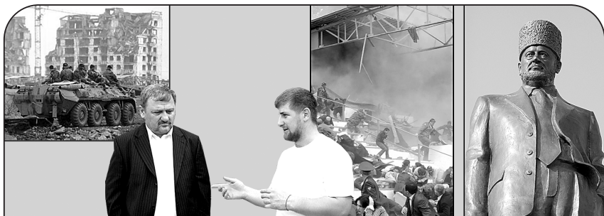
Так выглядел Грозный в 1995 году

И Ахмад Кадыров в 2004 году был убит террористами во время праздничного парада ко Дню Победы на стадионе в Грозном. За что? Он срывал их планы.