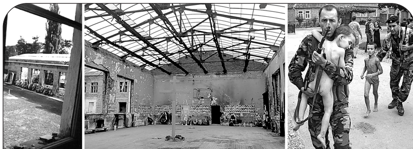
Из этого окна пулемет террористов поливал свинцом детей, разбежавшихся после взрыва в спортзале.

Но именно это и нужно было террористам: чем больше ужаса, тем легче добиться своего. Они знали, что за стенами школы мечутся обезумевшие от горя родственники заложников. Они видели из окон, что отцы захваченных детей рвутся к оружию. Все это воздействовало на власти, заставляло их лихорадочно искать выход из ситуации. Ведь власти понимали, что они не должны принимать условия террористов. Но еще лучше они понимали, что не имеют права допустить гибели заложников!