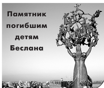
Памятник погибшим детям Беслана

Так почему же террористов называют словом «нелюди»?